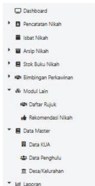
Gambar 6. Tampilan menu Pencatatan Nikah pada aplikasi SIMKAH di KUA Kecamatan Candi.